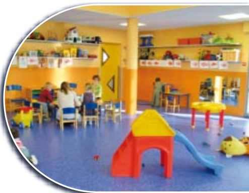
Maison des petits

Pour trouver une assistante maternelle sur Fondettes, vous pouvez contacter Mme Elodie Walter au 02 47 49 99 19.