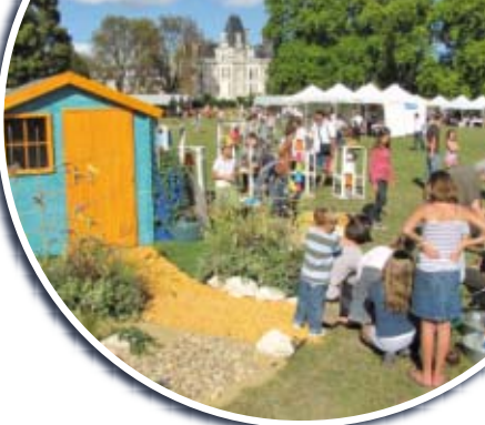
Un dimanche à la campagne